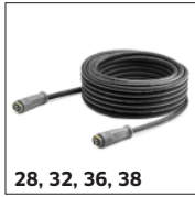
28, 32, 36, 38